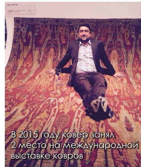
В 2015 году ковер занял 2 место на международной выставке ковров